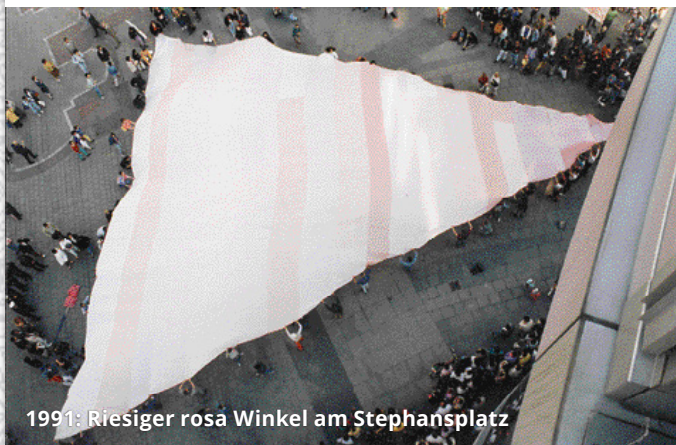
1991: Riesiger rosa Winkel am Stephansplatz

Am 26. Juni 1996 fand die 1. Regenbogenparade statt. Mit ihr stießen die CSD-Aktivitäten in Wien in neue, nie dagewesene Dimensionen vor, nicht zuletzt aufgrund der geschätzten 25.000 TeilnehmerInnen und der prestigeträchtigen Route über die Ringstraße. Wien stieg damit in eine neue Liga auf. Die Regenbogenparade wurde von einem engagierten Team, das zu diesem Zweck einen eigenen (CSD-)Verein