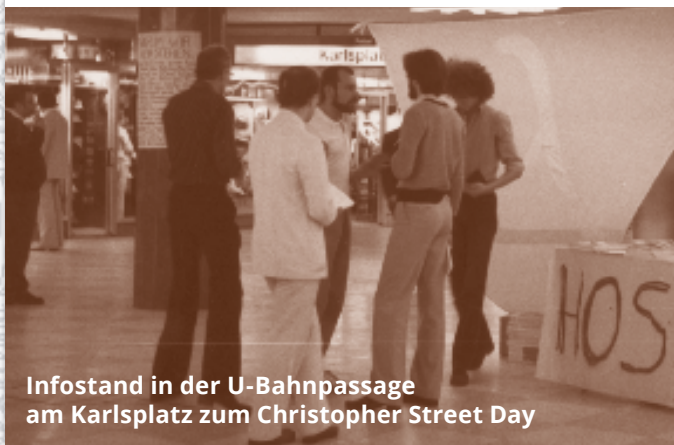
Infostand in der U-Bahnpassage am Karlsplatz zum Christopher Street Day