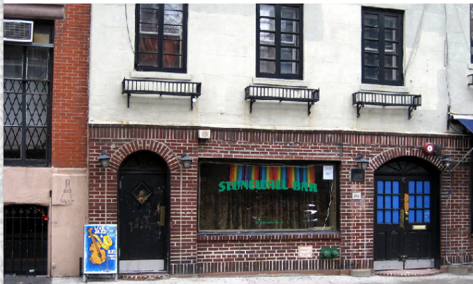
Das Stonewall Inn in der Christopher