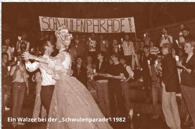
Ein Walzer bei der „Schwulenparade“ 1982

dem damaligen HOSI-Wien-Obmann einen Walzer zu tanzen. Offiziell pausierte der CSD 1983 in Wien. Zahlreiche Aktivitäten im Juni und Juli standen vielmehr ganz im Zeichen der Vorbereitung und Durchführung der 5. Weltkonferenz der „International Gay Association“, die im Juli in der Bundeshauptstadt stattfand. An den Universitäten fanden vom 13. bis 19. Juni mehrere Veranstaltungen unter dem Titel „Schwulen- und Lesbentage '83“ statt.